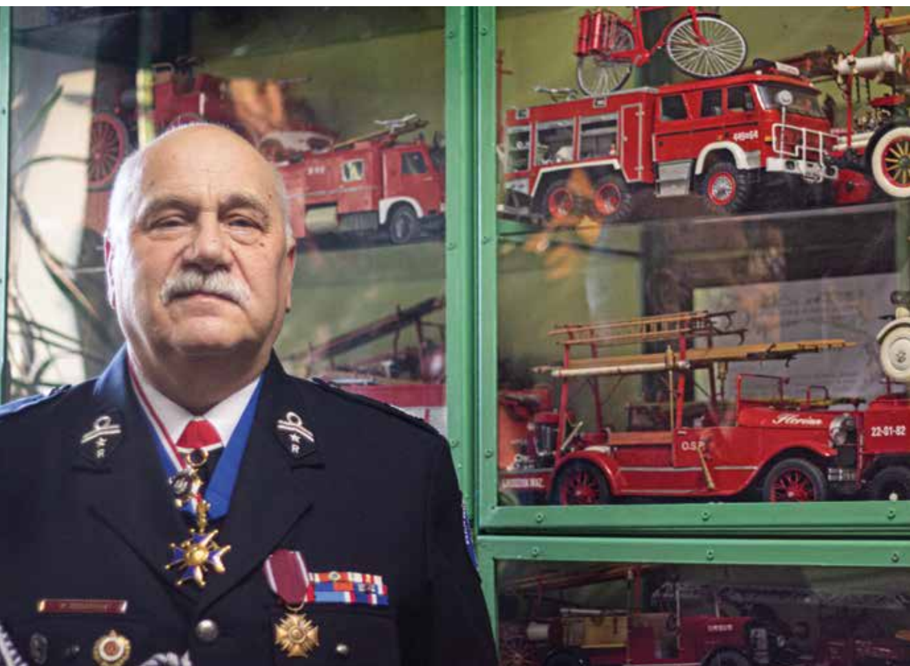
strażak OSP Grodzisk Maz., modelarz