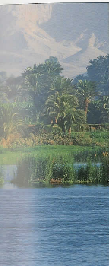
Kolory doliny Nilu; Górny Egipt.