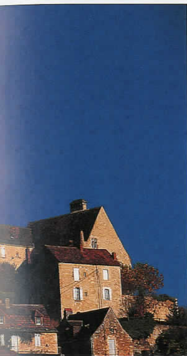
Ruiny zamku w dolinie Dordogne.