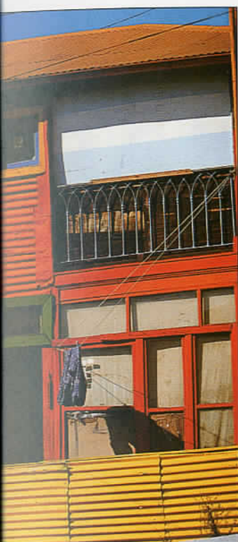
Kolorowe fasady El Caminito w Buenos Aires.