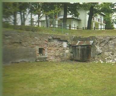
Fortyfikacje w Sieniawie s. 102