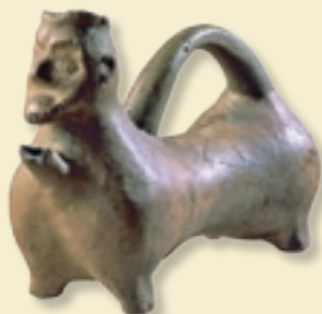
Aquamanile (Handwaschgefäß), Wien, 14. Jht.

NIMM WEINTRAUBEN UND ZERSTO- SSE SAURE (UNREIFE) ÄPFEL. DIES TU ZUSAMMEN, MISCH ES MIT WEIN UND PRESSE ES AUS. DIESE SAUCE IST GUT ZU GEBRATENEM SCHAF UND ZU HÜHNERN UND ZU FISCHEN.