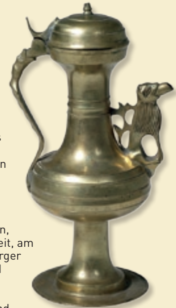
Enghalskanne, Tirol, um 1500

D ie Ausstellung zeigt die unterschiedlichen Speisenarten und Tischkulturen von Bauern, Bürgern, Adel und des Klerus am Beispiel typischer Gerätschaften und Rezepte sowie den Nahrungskreislauf von der Produktion über Handel und Veredelung bis zum gedeckten Tisch. Ein eigenes Thema ist die Entsorgung in Latrinen. Aus ihnen beziehen wir einen Großteil der archäologischen Kenntnisse über das Essen im Mittelalter. Zahlreiche Beispiele der Buch- und Tafelmalerei lassen die Besucher am Essen und Fasten, an der Mühsal der Landarbeit, am gefährvollen Handel der Bürger mit Gewürzen und Wein und am Tischluxus der Reichen teilhaben. Gewürze und Rohstoffe können gefühlt und gerochen werden. Nachbauten von gedeckten Tischen, ein Marktstand und eine Latrine illustrieren die Esskultur.