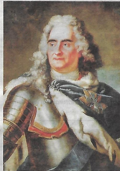
Król Polski August II Mocny.