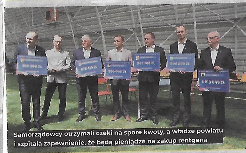
Samorządowcy otrzymali czeki na spore kwoty, a władze powiatu i szpitala zapewniły, że będą pieniądze na zakup rentgena