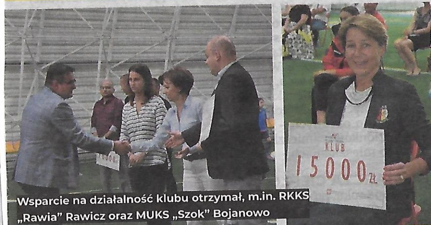
Wsparcie na działalność klubu otrzymał, m.in. RKKS „Rawia” Rawicz oraz MUKS „Szok” Bojanowo