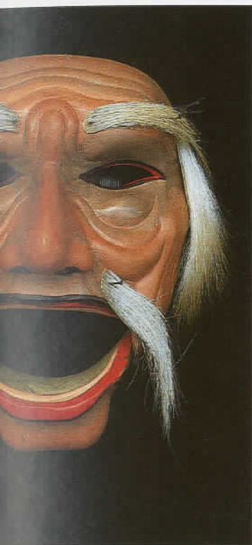
Maski topeng .