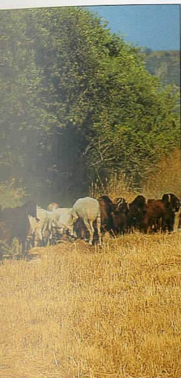
Chłopiec pasący kozy na jałowych terenach w okolicy Agia Napa.